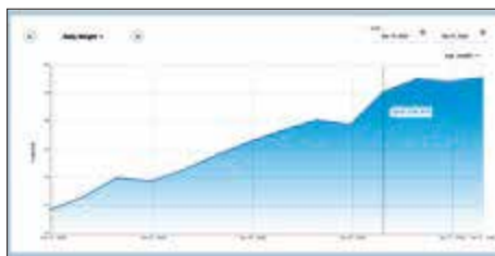
Peso médio diário do grupo