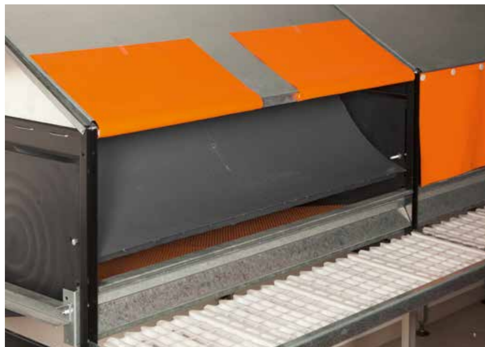
*220 aves/módulo – Matriz pesada – 240 aves/módulo matriz leve